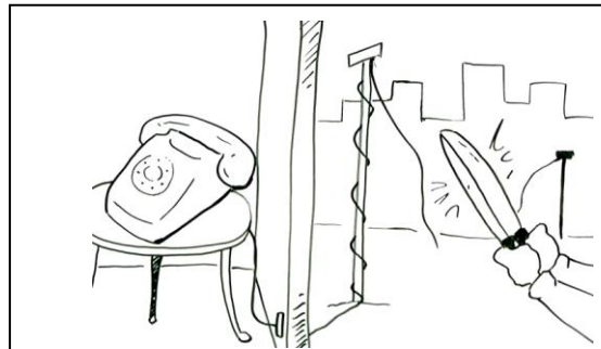
Fin de la téléphonie – la majorité de la population suisse concernée

2 millions de ménages, plus de 280 000 entreprises et quelque 70 000 centraux téléphoniques sont concernés par ce changement. En décidant d'arrêter les équipements de téléphonie commutée pour activer le « tout IP », l'opérateur historique Swisscom annonce la fin de la téléphonie classique en 2017. Cette mesure touche directement les utilisateurs des lignes analogiques et numériques (ISDN), c'est-à-dire une majorité de la population suisse.